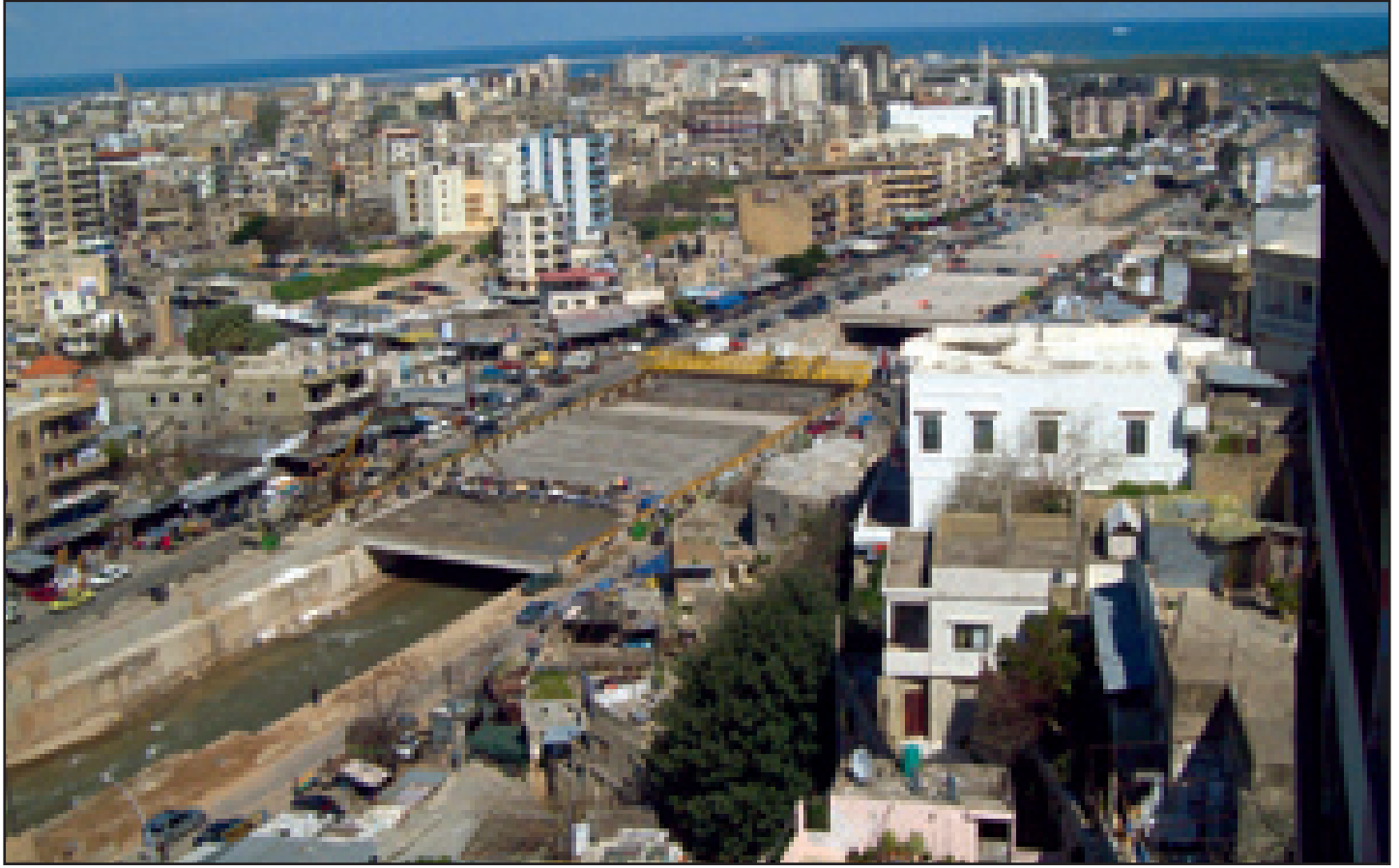
مشروع الإرث الثقافي - ترميم ضفاف نهر أبو على وإنشاء سقيفة فوق النهر (طرابلس)

للسناعات) وإنشاء المرصد اللبناني للبيئة والإنماء LEDO وتعزيز الوحدة الدائمة للإعلام البيئي في وزارة البيئة وبرنامج التخطيط الاستثماري للبيئة (IPP) ومشروع دعم استصدار التشريعات البيئية وتطبيقها في لبنان (SELDAS) ومشروع دعم التخطيط والإدارة البيئية على المستوى المحلي (TARGET).