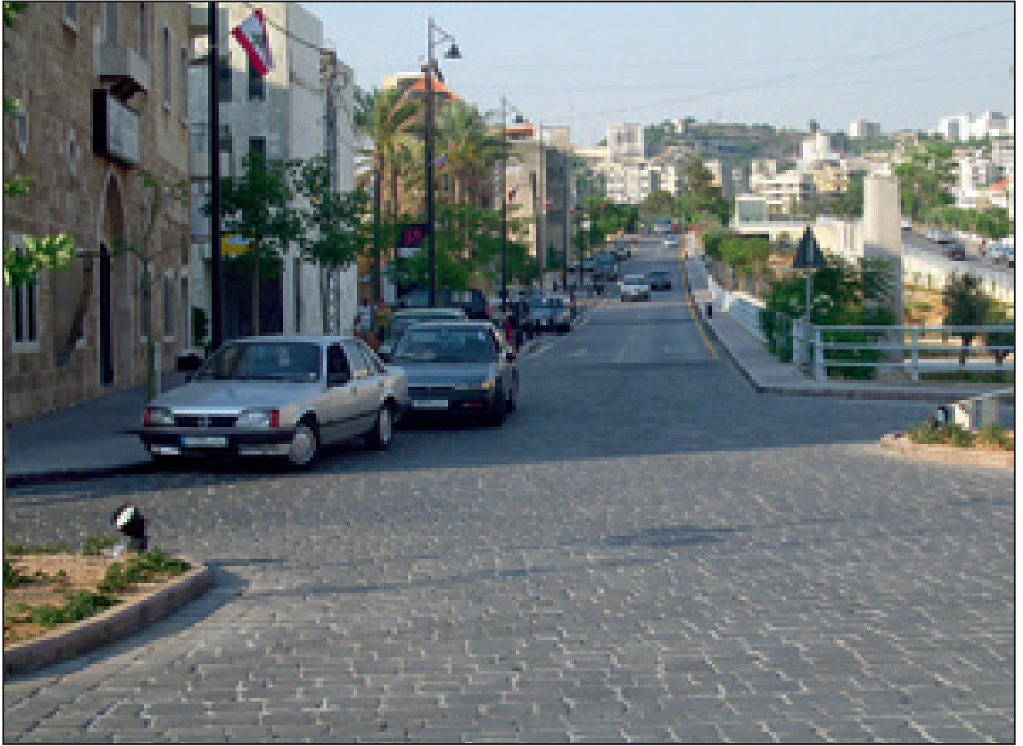
مشروع الإرث الثقافي - تأهيل الطريق الروماني والساحات الخارجية (جبيل)

لمشروع تأهيل خان العرسات وحمّام النوري، والعقار ١٣١. ■ تلزيم إعداد الدراسات التفصيلية لمشروع تأهيل الواجهات الشرقية من نهر أبو علي. ■ تلزيم أشغال مشروع تأهيل خان العسكر. ■ تلزيم أشغال تأهيل الواجهات، الطرق والساحات العامة في الأسواق الشمالية والشرقية المرحلة الثانية.