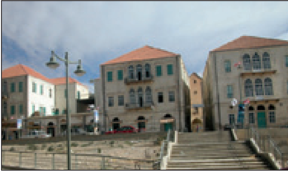
مشروع الإرث الثقافي - تأهيل المدخل الجنوبي (بعلبك)

أيلول ٢٠٠٥ وأُرفق بها مشروع مرسوم وتمّ عرضه على مقام مجلس الوزراء، في هذه الفترة، قام مجلس الإنماء والإعمار ببعض النشاطات الآيلة إلى تعميم هذه الخطة بشكل واسع وإلى وضع بعض توصياتها موضع التنفيذ.