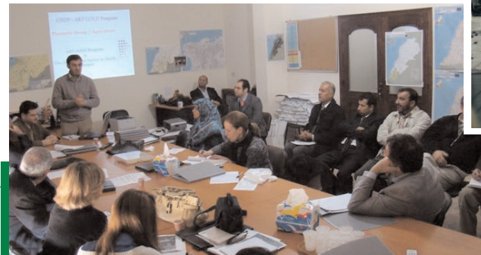
Réunion de travail ART GOLD Lebanon