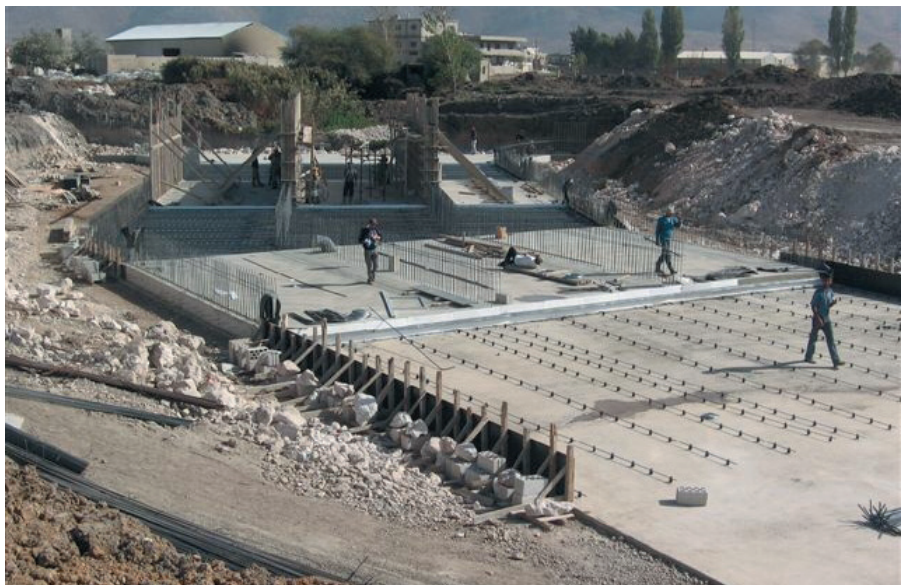
Travaux en cours sur l'autoroute arabe : Taanayel - Masnaa