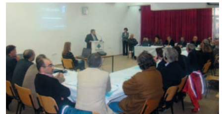
Réunion de travail ART GOLD Lebanon

*N.B : Se référer à la description du projet dans le premier numéro de l'Édition.