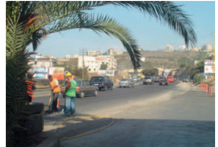
Autoroute Dora Tabarja - Réhabilitation

Le CDR a chargé la joint-venture Société Jihad pour le commerce et l'entreprise/Société Antoine Makhoulf de l'exécution du projet. Les travaux ont démarré le 5/7/2007, le délai d'exécution est d'un an; le financement est assuré entièrement par l'Etat libanais (loi no.246/1993); le coût des travaux est estimé à 16 millions de US $. Les travaux comprennent la réhabilitation des trottoirs endommagés, le ré asphaltage de l'ensemble de l'autoroute, la réhabilitation de l'éclairage et des canalisations d'eau de pluie, en plus de l'installation de feux de signalisation et de marquage routier.