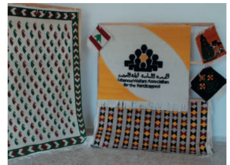
Activités de l'Atelier de Tapisserie

De la même manière que le drapeau de la nation a été tissé grâce au sacrifice, à l'amour et à l'orgueil des citoyens, ce projet tissera un avenir meilleur à ses filles et fils, avec comme atouts la laine, un métier à tisser et des motifs qui répondent aux aspirations d'une femme, au rêve d'une jeune fille et à la vision d'une société locale solidaire.