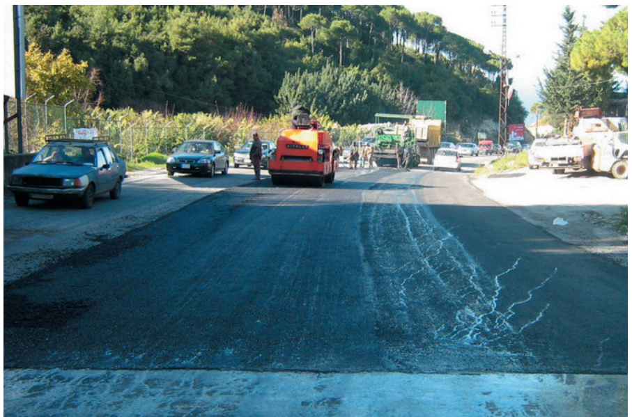
Route Jeita-Ouyoun Siman Réhabilitation

but d'améliorer les conditions de sécurité publique, en plus des travaux de réhabilitation sur certaines portions de la route (comme les travaux de canalisations pour l'écoulement des eaux de pluie).