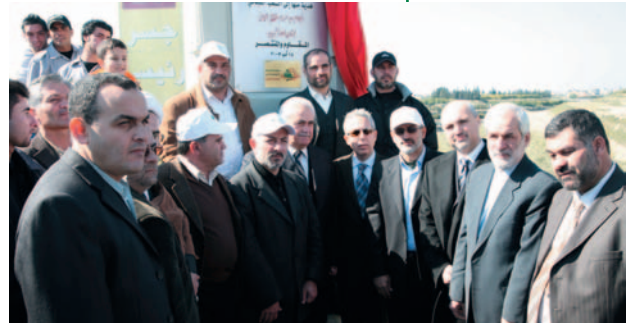
Cérémonie d'inauguration des Ponts au Sud